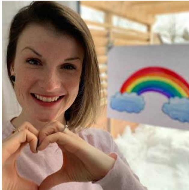
Mme Émilie Orthopédagogue