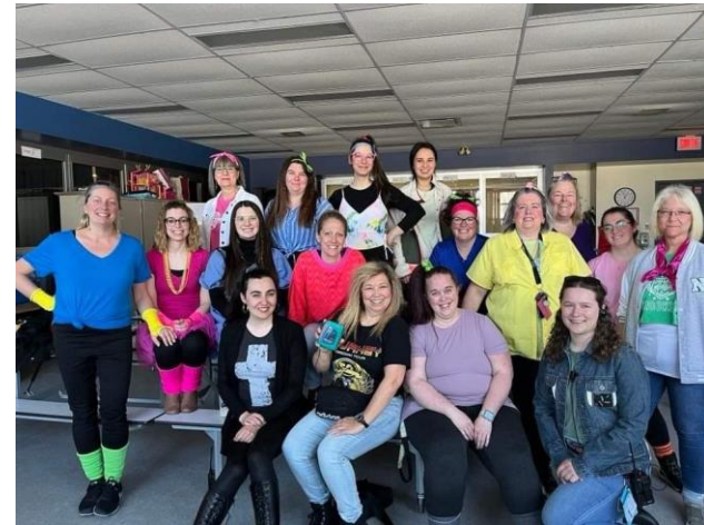
Les éducatrices en service de garde