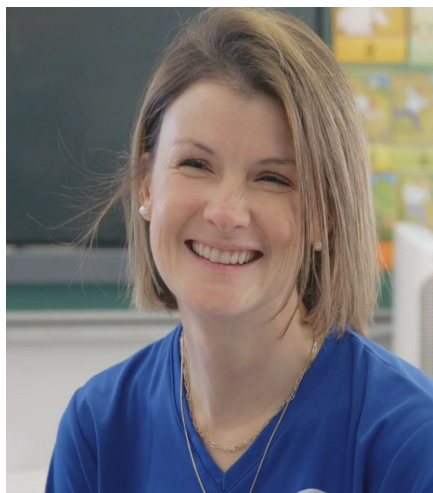
Madame Émilie Orthopédagogue